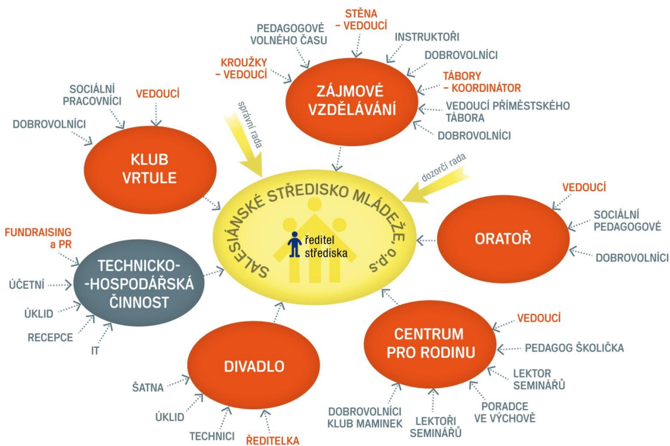
OBR. 3 Salesiánské středisko mládeže o.p.s.

Lektoři, kostelníci, farní kuchyňka a sklad, tým zástupců malých společenství, péče o farní zahradu a terasu.