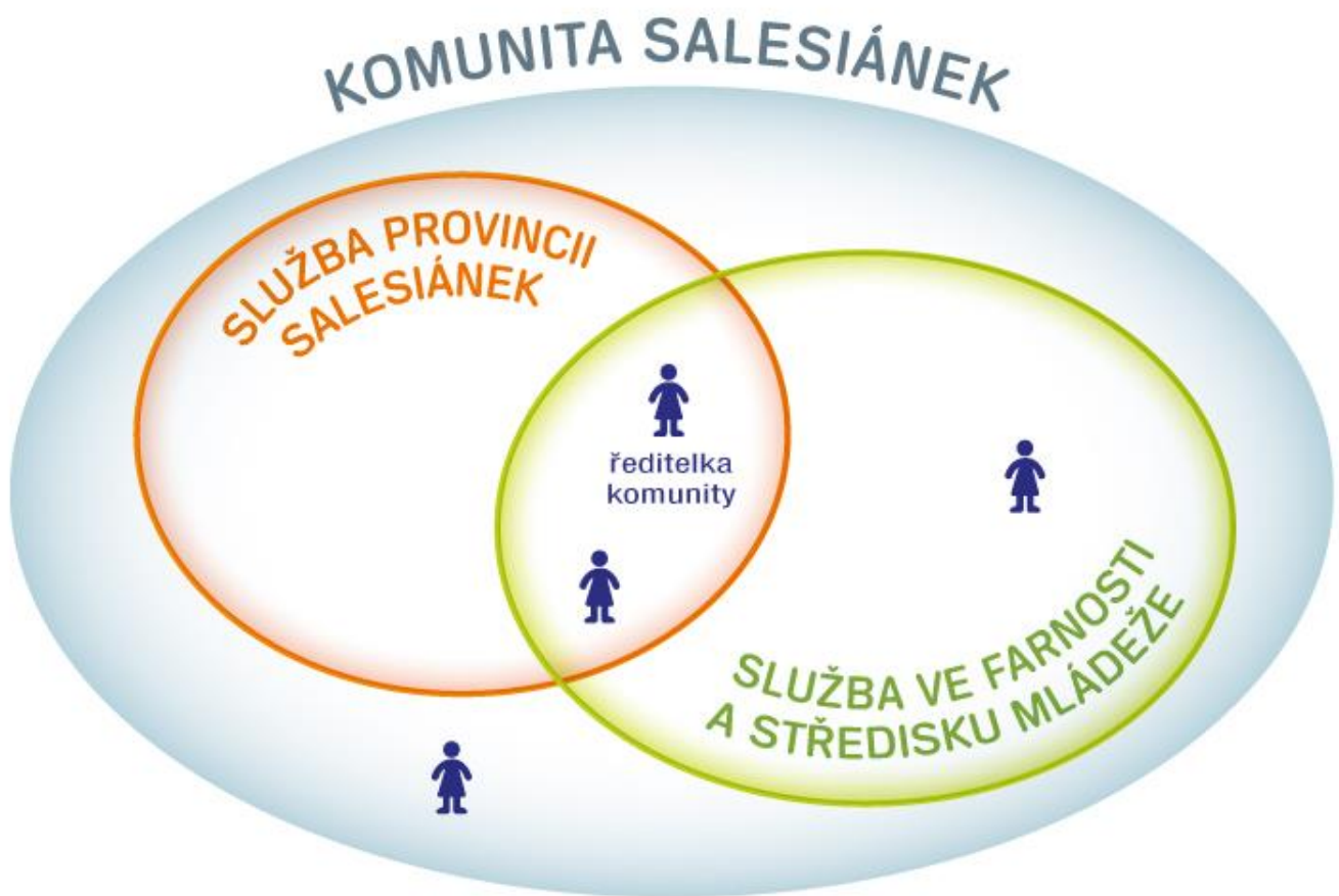
OBR. 5 Komunita salesiánů