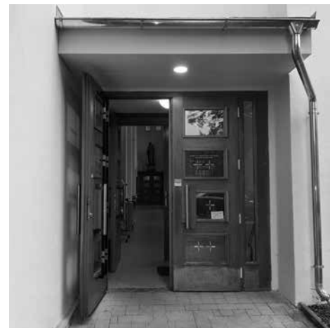
Přístřešek nad vchodem od parkoviště