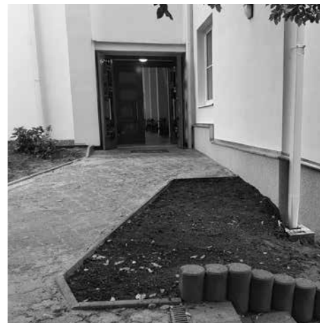
Rampa s nádrží na dešťovou vodu od zahrady